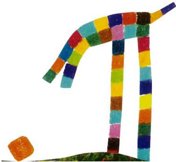
“Pezzettino” di Leo Lionni

Il weekend del Regina si arricchisce di due nuovi racconti letti dalle insegnanti